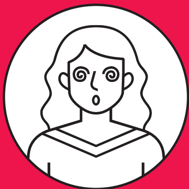
Troubles de la vue