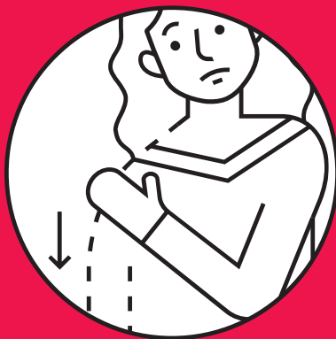
Paralysie dans les bras ou les jambes