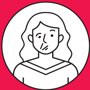
Paralysie au visage