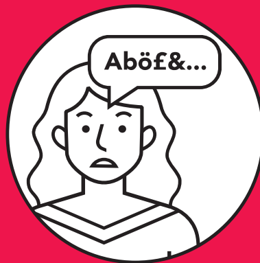
Troubles de la parole